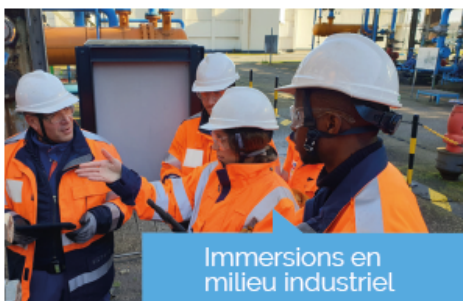
Immersion en milieu industriel

Votre École forme des jeunes talents qui se distingueront par leur capacité d'innovation et leur engagement et contribueront aux transformations à venir de manière responsable et durable.