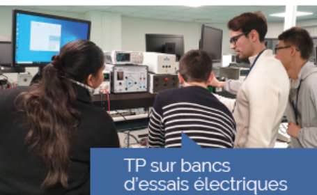
TP sur bancs d'essais électriques

La transition énergétique est un défi d'ampleur qui revêt de nombreux enjeux : augmenter la production d'énergies bas carbone, décarboner les procédés industriels, électrifier massivement les transports... Elle requiert une formation de pointe de professionnels, ingénieur(e)s en tête.