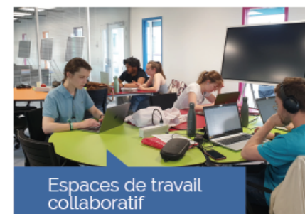
Espaces de travail collaboratif

Vos dons sont essentiels à la concrétisation de nos actions ! Pour cette nouvelle collecte de fonds, nous visons le financement de deux nouvelles Bourses d'Excellence pour un objectif de collecte de 30 000 €.